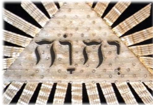
Även på ett predikstolskläde finns gudsnamnet JHWH med hebreiska bokstäver

Namnet Jehova, Jehovah, Jahve eller med de hebreiska bokstäverna JHWH (JHVH) förekommer i en mängd kyrkobyggnader och på olika föremål. Gudsnamnet finns också med i betydelsen i många namn. Exempel: Jesus betyder " Jehova är räddning ". Halleluja betyder " Lovprisa Jah " (Jah är en förkortad form av Jehova)