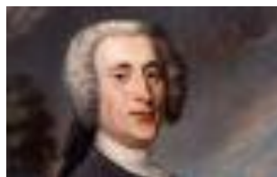
Författaren Samuel Columbus (1642-1679) använde gudsnamnet Jehovah i sina skrifter. Bokverket "Bibliske Werld" är tryckt i Stockholm 1687.