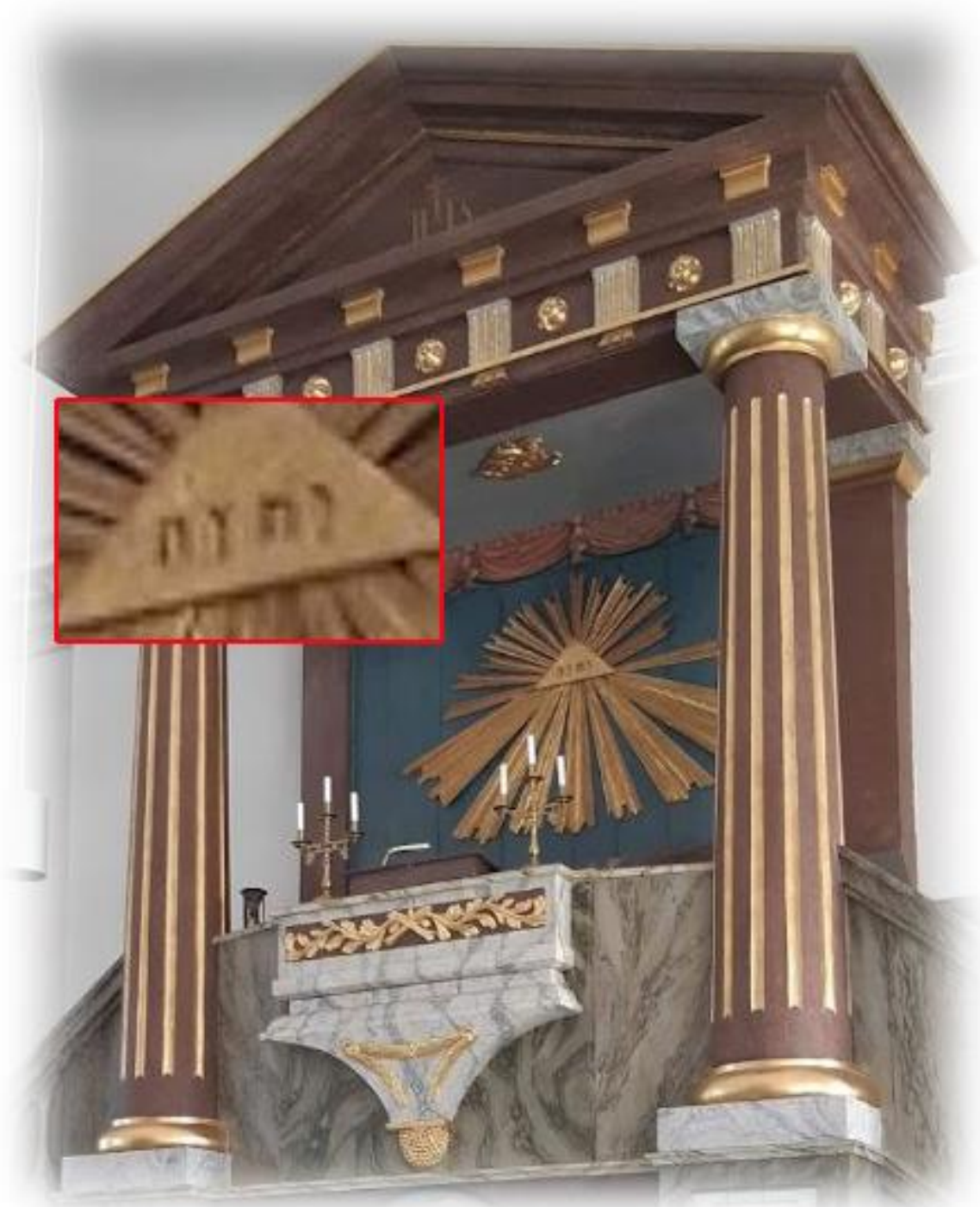
På altarpredikstolen finns gudsnamnet JHWH med hebreiska bokstäver

JHWH, även kallat tetragrammet eller tetragrammaton, förekommer nästan 7000 gånger i den hebreiska texten i Bibeln