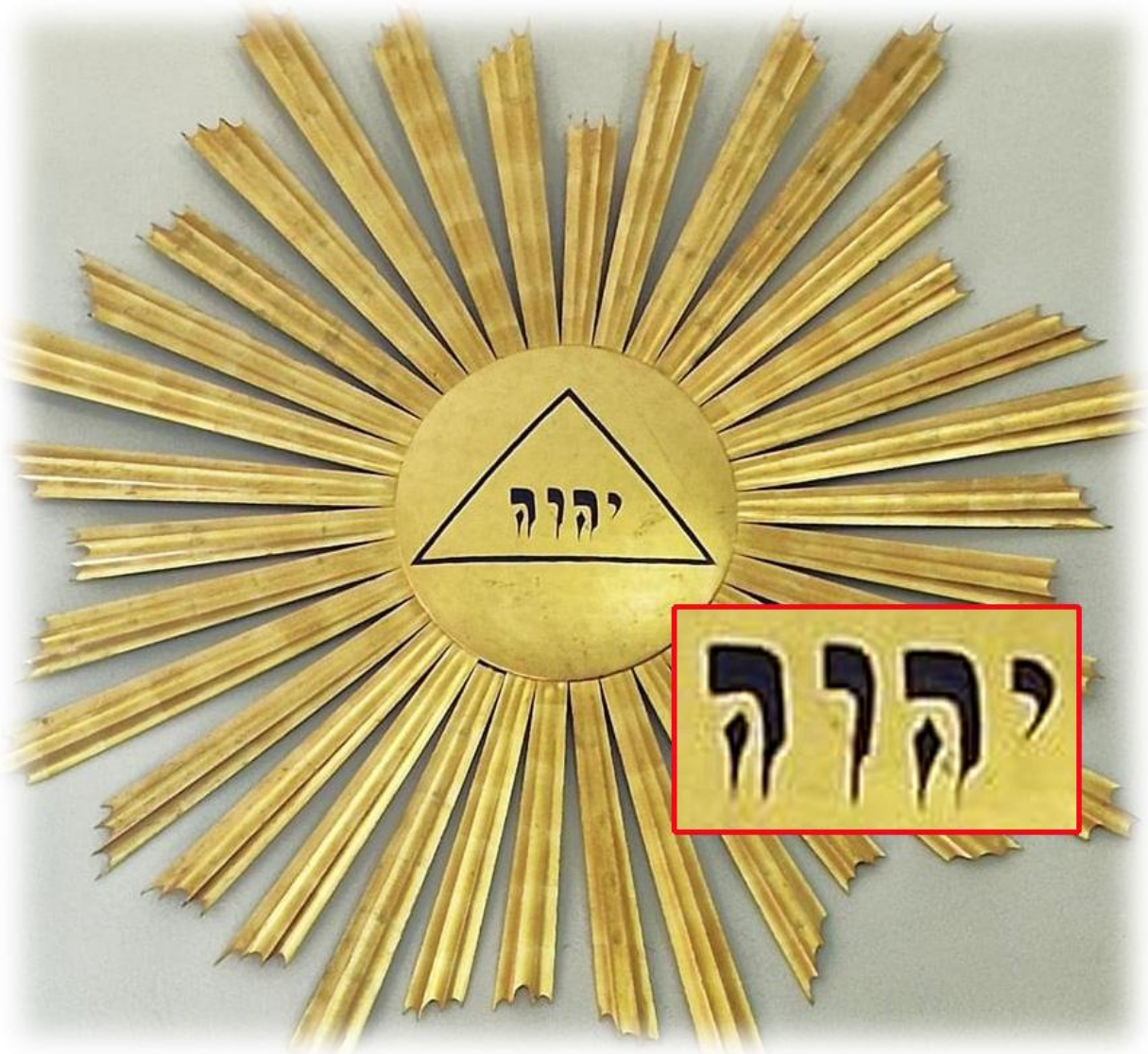
På en strålsol finns gudsnamnet JHWH med hebreiska bokstäver

Namnet Jehova, Jehovah, Jahve eller med de hebreiska bokstäverna JHWH (JHVH) förekommer i en mängd kyrkobyggnader och på olika föremål. Gudsnamnet finns också med i betydelsen i många namn. Exempel: Jesus betyder " Jehova är räddning ". Halleluja betyder " Lovprisa Jah " (Jah är en förkortad form av Jehova)