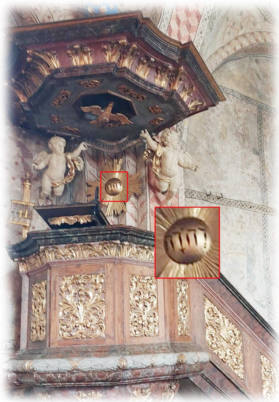
På predikstolen från 1707 av Joakim Lutkenschwanger finns gudsnamnet JHWH med hebreiska bokstäver

Namnet Jehova, Jehovah, Jahve eller med de hebreiska bokstäverna JHWH (JHVH) förekommer i en mängd kyrkobyggnader och på olika föremål. Gudsnamnet finns också med i betydelsen i många namn. Exempel: Jesus betyder " Jehova är räddning ". Halleluja betyder " Lovprisa Jah " (Jah är en förkortad form av Jehova)