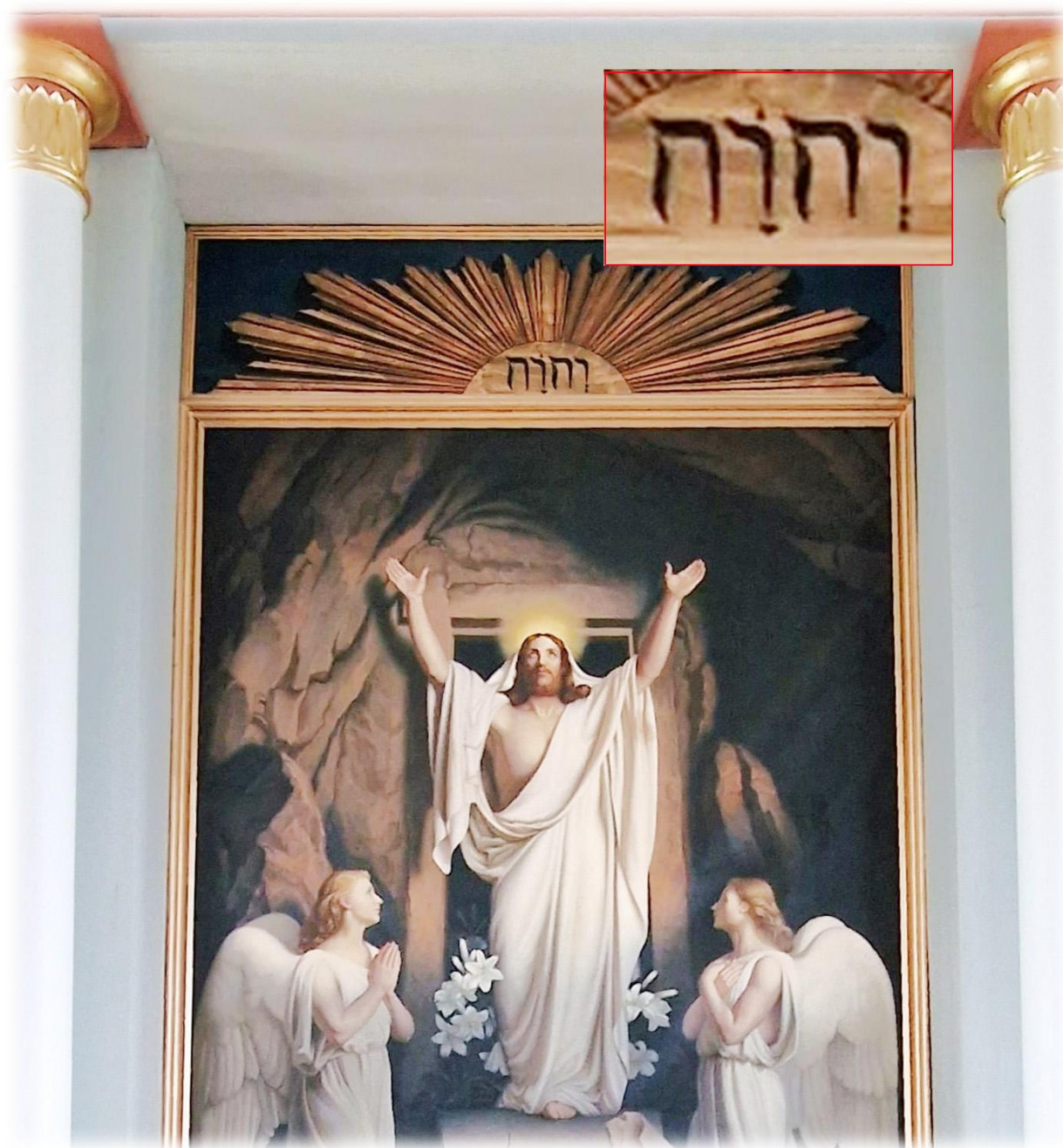
Ovanför altartavlan från 1902 finns gudsnamnet JHWH med hebreiska bokstäver (läses från höger till vänster)

JHWH, även kallat tetragrammet eller tetragrammaton, förekommer omkring 7000 gånger i Bibelns grundtext