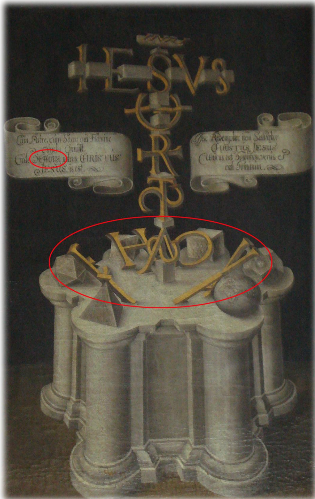
I tavlan från 1640-talet, gjord av holländska konstnären Adam Horislaamb, finns gudsnamnet Jehova på två ställen; i den vänstra textbanderollen och i bokstäverna som vilar på fundamentet

JHWH, även kallat tetragrammet eller tetragrammaton, förekommer omkring 7000 gånger i Bibelns grundtext