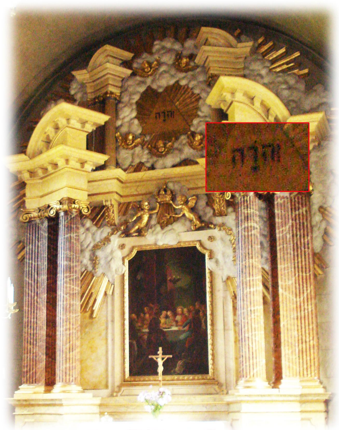
På altaruppsatsen från 1897 finns gudsnamnet JHWH med hebreiska bokstäver