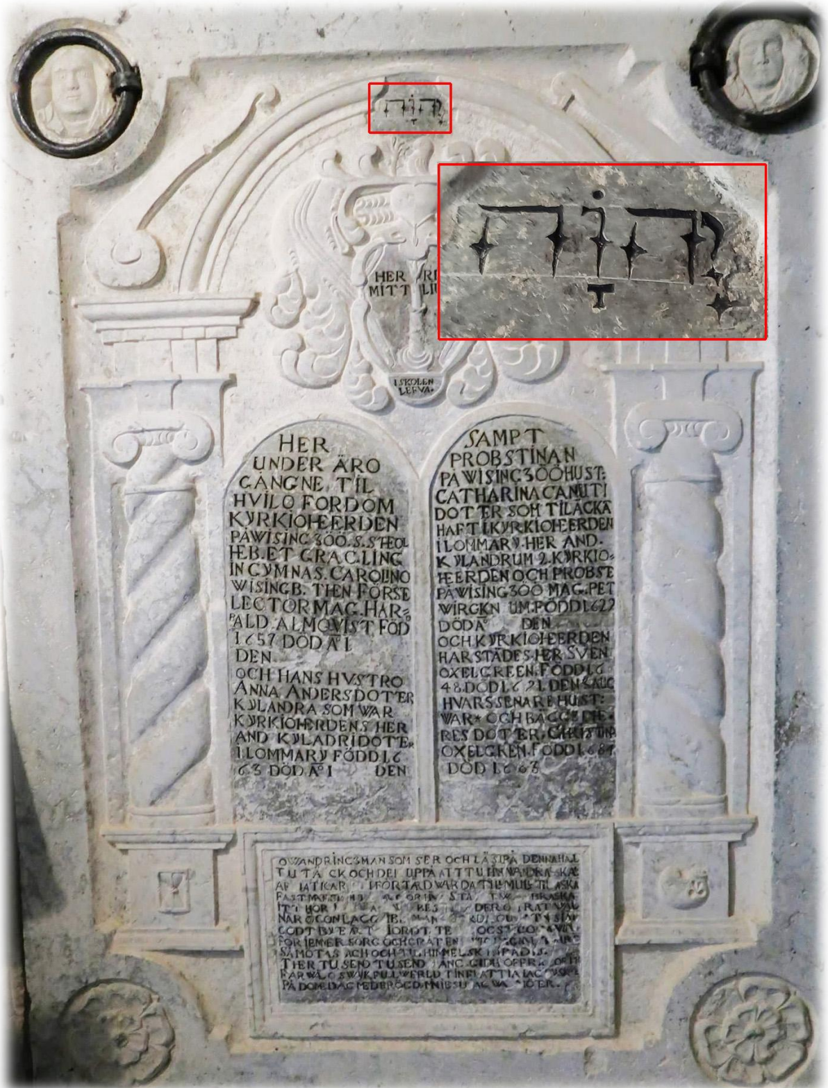
På en gravsten i vapenhuset finns gudsnamnet JHWH med hebreiska bokstäver (läses från höger till vänster)

JHWH, även kallat tetragrammet eller tetragrammaton, förekommer omkring 7000 gånger i Bibelns grundtext