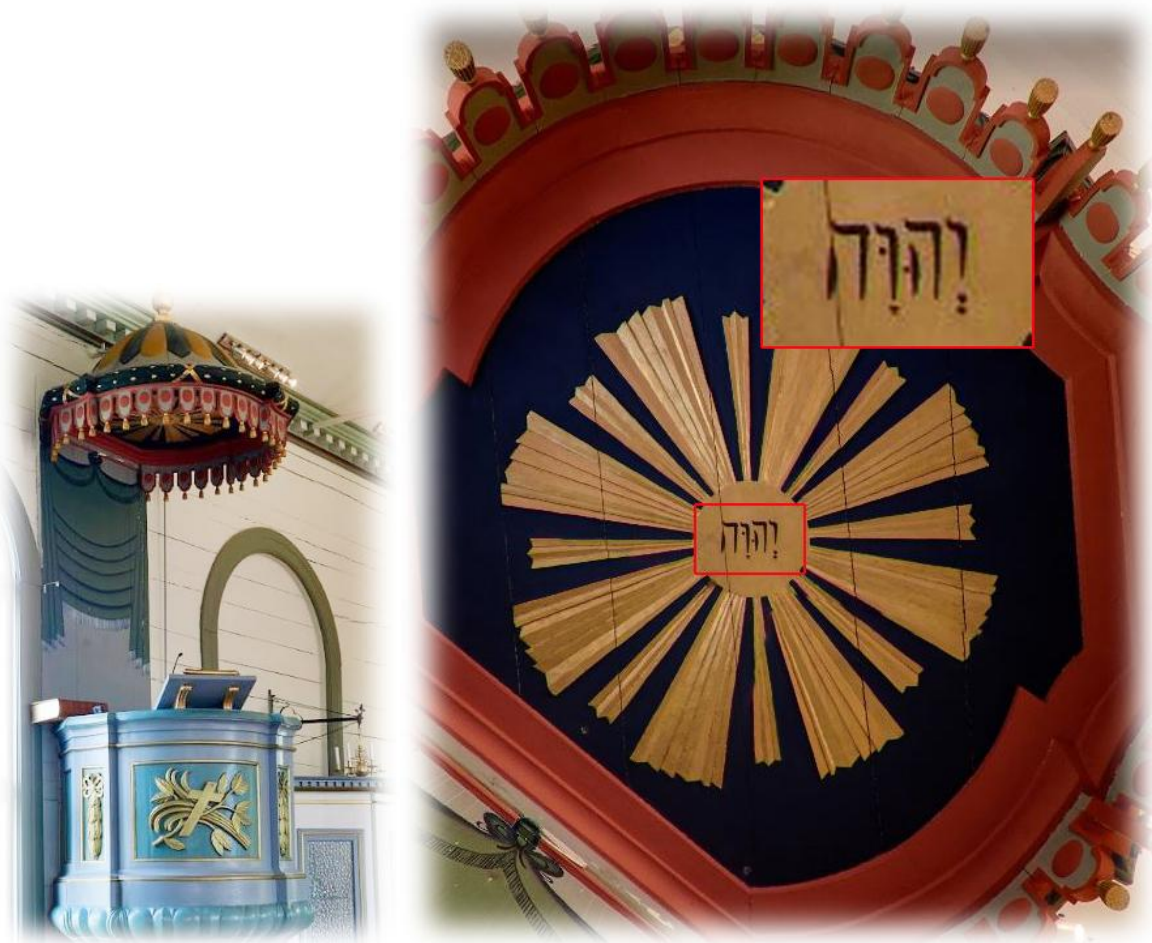
På predikstolens baldakintak finns gudsnamnet JHWH med hebreiska bokstäver

Namnet Jehova, Jehovah, Jahve eller med de hebreiska bokstäverna JHWH (JHVH) förekommer i en mängd kyrkobyggnader och på olika föremål. Gudsnamnet finns också med i betydelsen i många namn. Exempel: Jesus betyder " Jehova är räddning ". Halleluja betyder " Lovprisa Jah " (Jah är en förkortad form av Jehova)