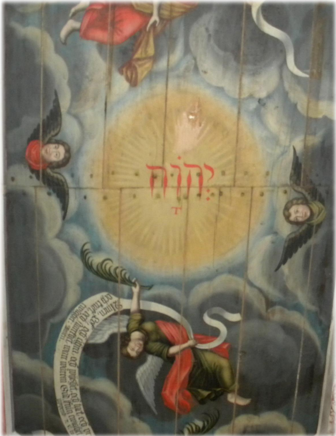
I takmålningarna, som gjordes under 1720- och 1730-talet, finns gudsnamnet JHWH med hebreiska bokstäver (läses från höger till vänster)

JHWH, även kallat tetragrammet eller tetragrammaton, förekommer omkring 7000 gånger i Bibelns grundtext