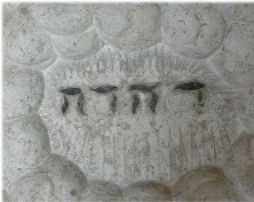
På Fehmanska epitafiet från 1600-talet finns gudsnamnet JHWH med hebreiska bokstäver

Namnet Jehova, Jehovah, Jahve eller med de hebreiska bokstäverna JHWH (JHVH) förekommer i en mängd kyrkobyggnader och på olika föremål. Gudsnamnet finns också med i betydelsen i många namn. Exempel: Jesus betyder " Jehova är räddning ". Halleluja betyder " Lovprisa Jah " (Jah är en förkortad form av Jehova)