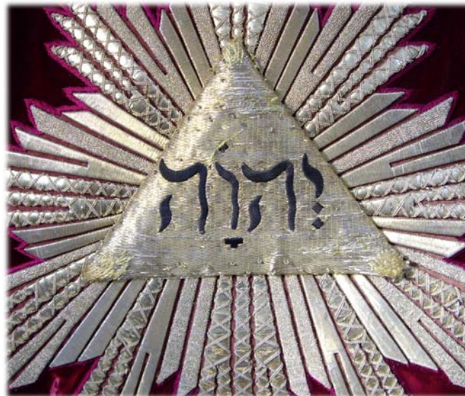
Även på en äldre mässhake finns gudsnamnet JHWH med hebreiska bokstäver

Namnet Jehova, Jehovah, Jahve eller med de hebreiska bokstäverna JHWH (JHVH) förekommer i en mängd kyrkobyggnader och på olika föremål. Gudsnamnet finns också med i betydelsen i många namn. Exempel: Jesus betyder ” Jehova är räddning ”. Halleluja betyder ” Lovprisa Jah ” (Jah är en förkortad form av Jehova)