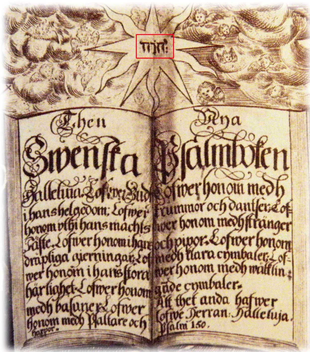
I ett psalmtryck från 1701 finns gudsnamnet JHWH med hebreiska bokstäver

JHWH, även kallat tetragrammet eller tetragrammaton, förekommer 6828 gånger i den hebreiska texten i Bibeln