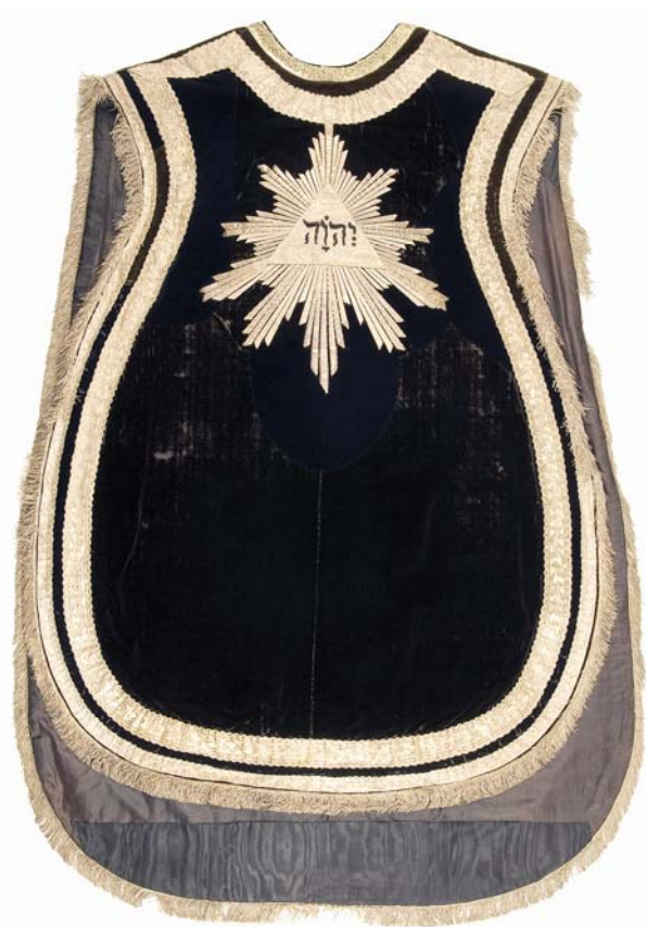
Även på två mässhakar från 1791 finns gudsnamnet JHWH med hebreiska bokstäver