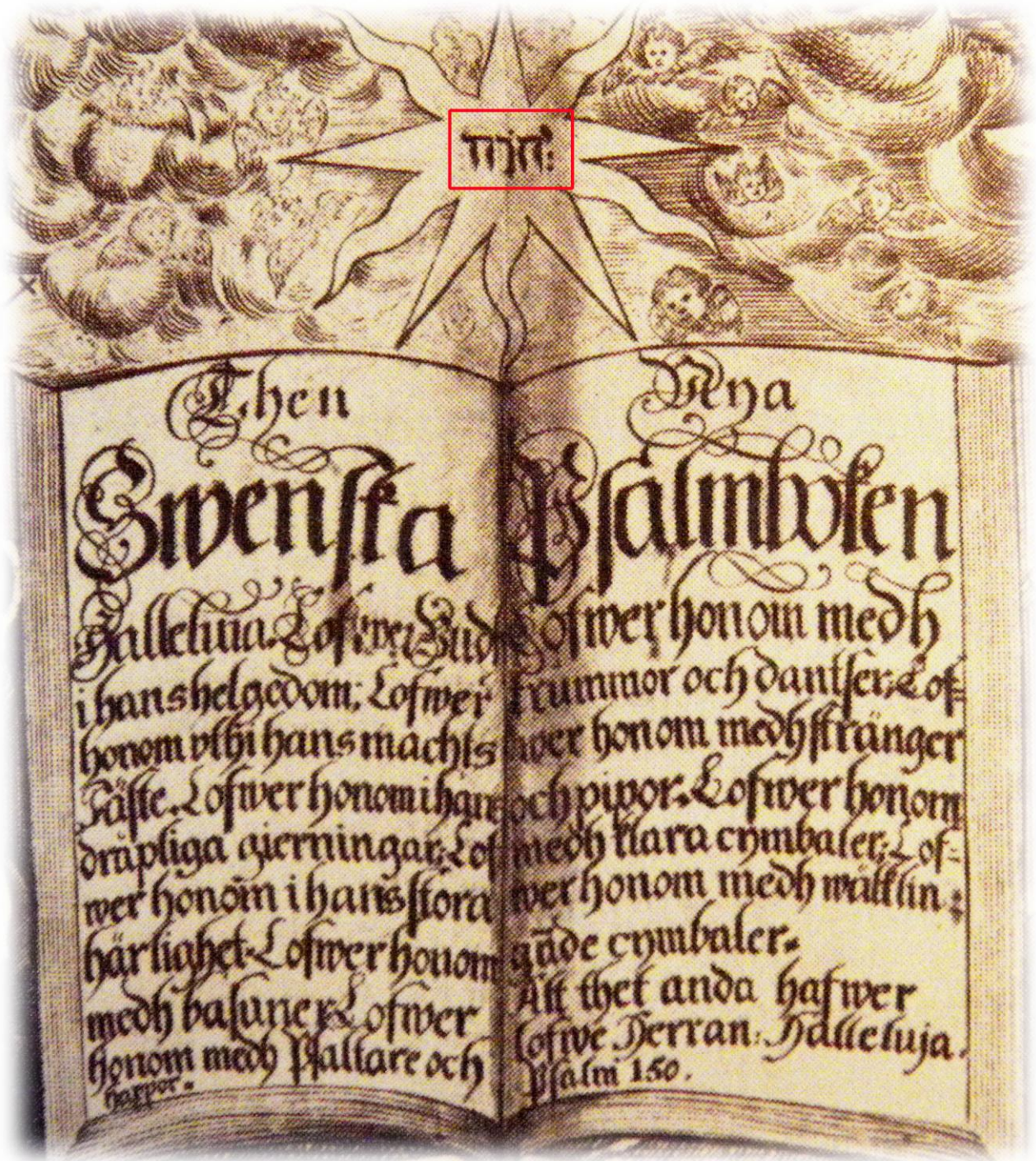
I ett psalmtryck från 1701 finns gudsnamnet JHWH med hebreiska bokstäver (Uppsala domkyrkas arkiv)