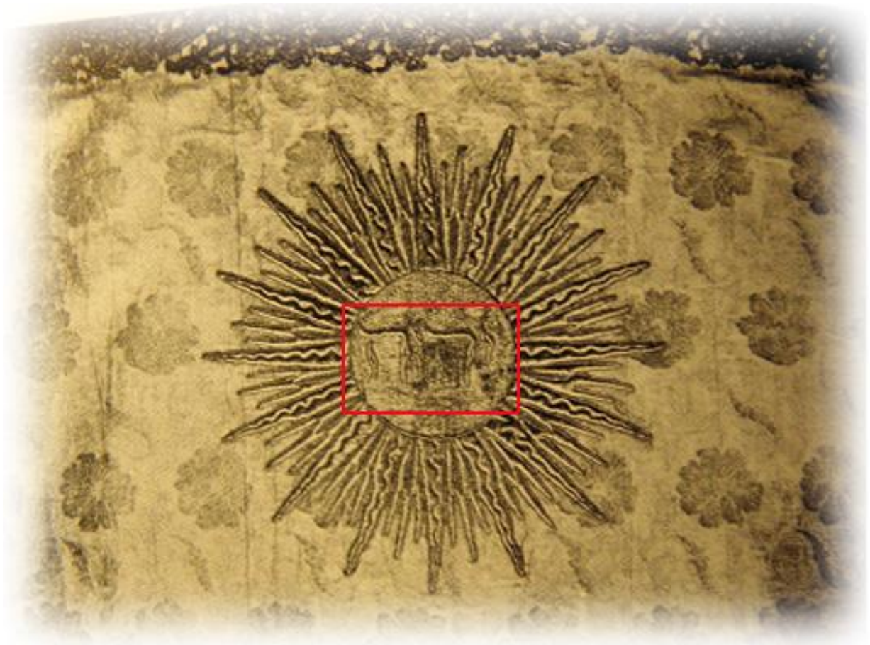
På ett antependium från 1734 finns också gudsnamnet JHWH med hebreiska bokstäver

Namnet Jehova, Jehovah, Jahve eller med de hebreiska bokstäverna JHWH (JHVH) förekommer i en mängd kyrkobyggnader och på olika föremål. Gudsnamnet finns också med i betydelsen i många namn. Exempel: Jesus betyder " Jehova är räddning ". Halleluja betyder " Lovprisa Jah " (Jah är en förkortad form av Jehova)