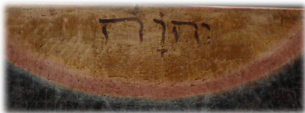
På ett epitafium från 1668 över familjen Aussenius finns gudsnamnet JHWH med hebreiska bokstäver (läses från höger till vänster)