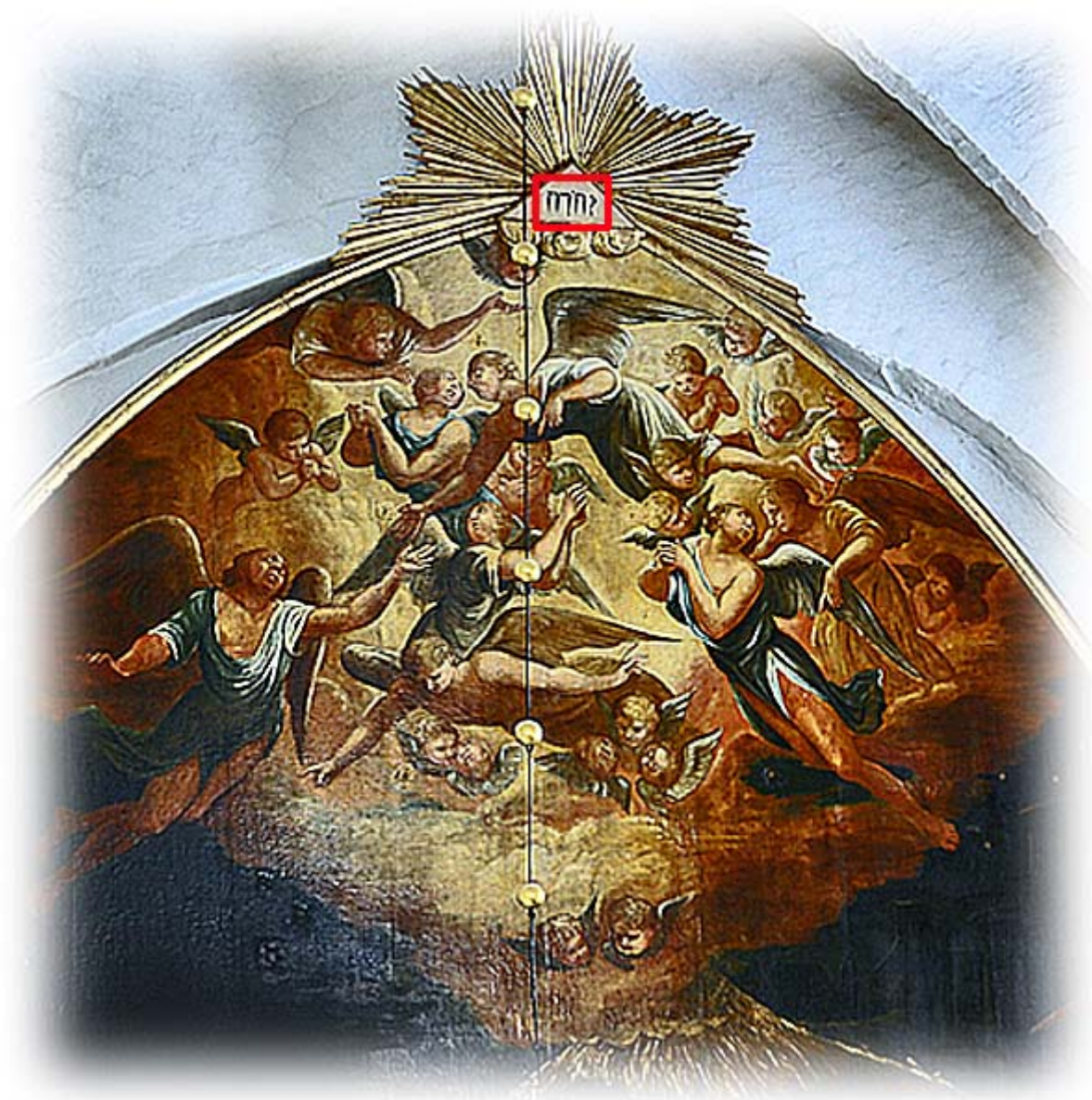
Även ovanför altartavlan från 1802 finns gudsnamnet JHWH med hebreiska bokstäver

Namnet Jehova, Jehovah, Jahve eller med de hebreiska bokstäverna JHWH (JHVH) förekommer i en mängd kyrkobyggnader och på olika föremål. Gudsnamnet finns också med i betydelsen i många namn. Exempel: Jesus betyder " Jehova är räddning ". Halleluja betyder " Lovprisa Jah " (Jah är en förkortad form av Jehova)