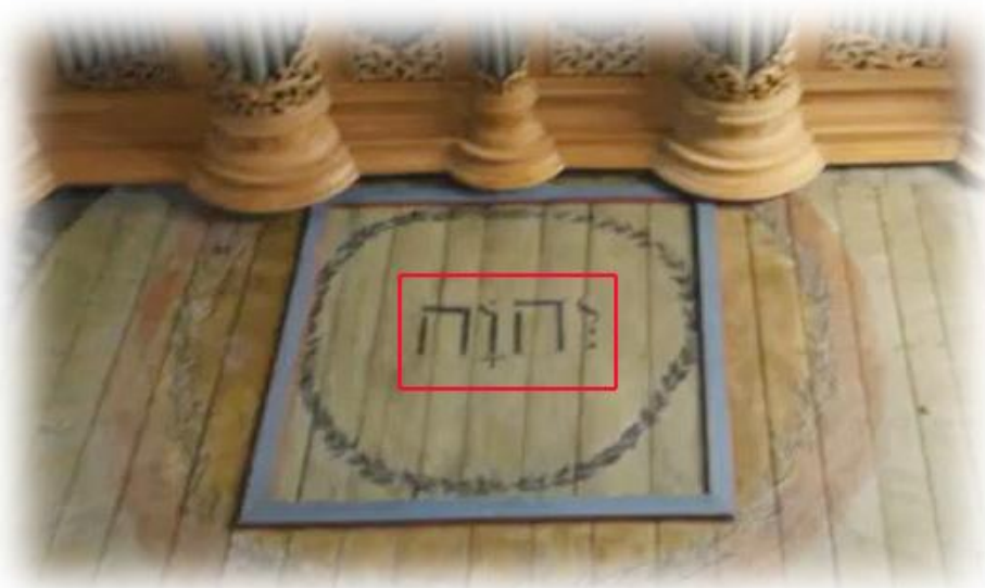
Här syns tetragrammet rättvänt (läses från höger till vänster)

Namnet Jehova, Jehovah, Jahve eller med de hebreiska bokstäverna JHWH (JHVH) förekommer i en mängd kyrkobyggnader och på olika föremål. Gudsnamnet finns också med i betydelsen i många namn. Exempel: Jesus betyder " Jehova är räddning ". Halleluja betyder " Lovprisa Jah " (Jah är en förkortad form av Jehova)