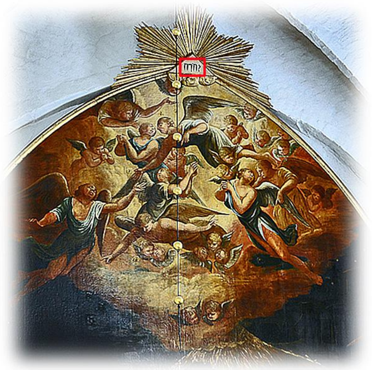
Även ovanför altartavlan från 1802 finns gudsnamnet JHWH med hebreiska bokstäver

Namnet Jehova, Jehovah, Jahve eller med de hebreiska bokstäverna JHWH (JHVH) förekommer i en mängd kyrkobyggnader och på olika föremål. Gudsnamnet finns också med i betydelsen i många namn. Exempel: Jesus betyder " Jehova är räddning ". Halleluja betyder " Lovprisa Jah " (Jah är en förkortad form av Jehova)