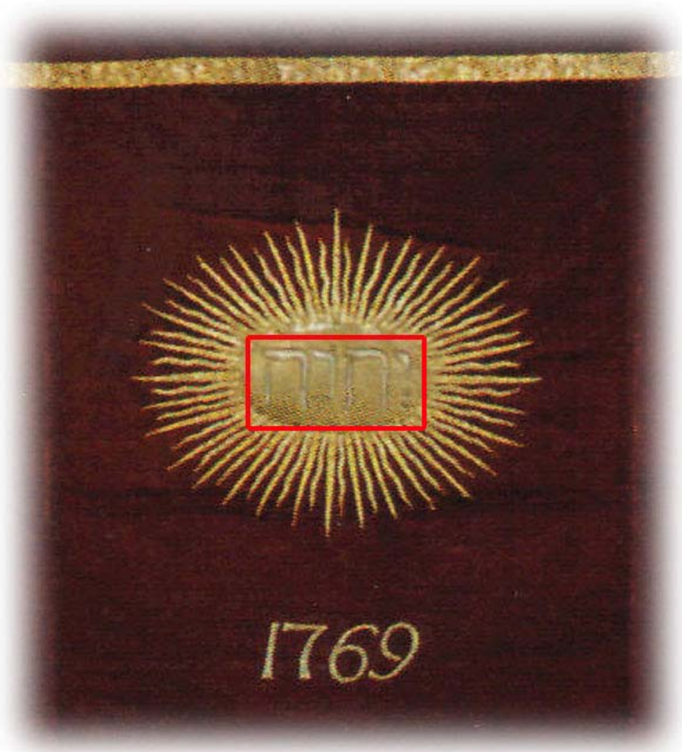
På ett antependium från 1769 finns gudsnamnet JHWH med hebreiska bokstäver

Namnet Jehova, Jehovah, Jahve eller med de hebreiska bokstäverna JHWH (JHVH) förekommer i en mängd kyrkobyggnader och på olika föremål. Gudsnamnet finns också med i betydelsen i många namn. Exempel: Jesus betyder " Jehova är räddning ". Halleluja betyder " Lovprisa Jah " (Jah är en förkortad form av Jehova)