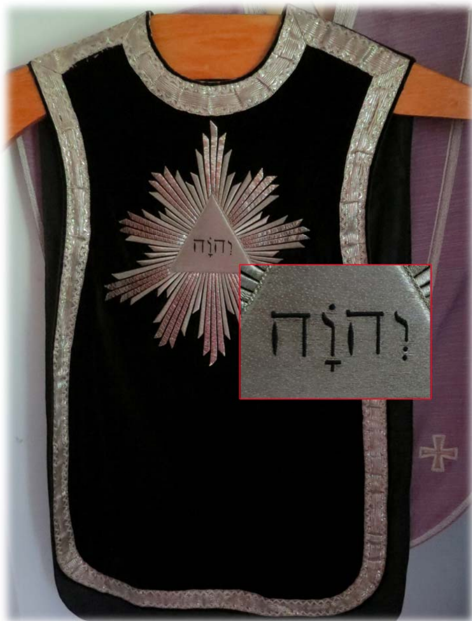
Även på en äldre mässhake finns gudsnamnet JHWH med hebreiska bokstäver

Namnet Jehova, Jehovah, Jahve eller med de hebreiska bokstäverna JHWH (JHVH) förekommer i en mängd kyrkobyggnader och på olika föremål. Gudsnamnet finns också med i betydelsen i många namn. Exempel: Jesus betyder " Jehova är räddning ". Halleluja betyder " Lovprisa Jah " (Jah är en förkortad form av Jehova)