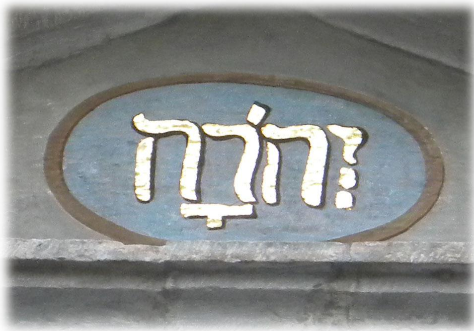
Ovanför kyrkporten finns gudsnamnet JHWH med hebreiska bokstäver (läses från höger till vänster)