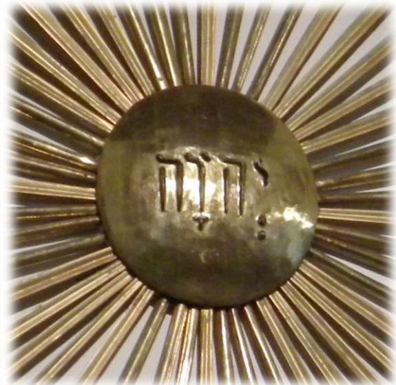
Även på väggen bakom predikstolen, som blev färdig 1675, finns gudsnamnet JHWH med hebreiska bokstäver

Namnet Jehova, Jehovah, Jahve eller med de hebreiska bokstäverna JHWH (JHVH) förekommer i en mängd kyrkobyggnader och på olika föremål. Gudsnamnet finns också med i betydelsen i många namn. Exempel: Jesus betyder " Jehova är räddning ". Halleluja betyder " Lovprisa Jah " (Jah är en förkortad form av Jehova)