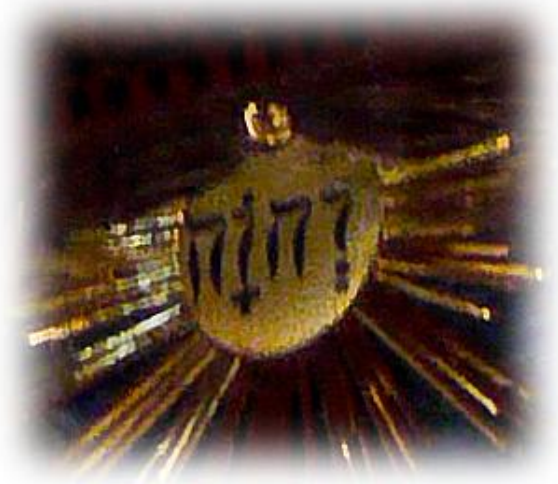
Predikstolen från 1756 har även gudsnamnet JHWH med hebreiska bokstäver

Namnet Jehova, Jehovah, Jahve eller med de hebreiska bokstäverna JHWH (JHVH) förekommer i en mängd kyrkobyggnader och på olika föremål. Gudsnamnet finns också med i betydelsen i många namn. Exempel: Jesus betyder " Jehova är räddning ". Halleluja betyder " Lovprisa Jah " (Jah är en förkortad form av Jehova)