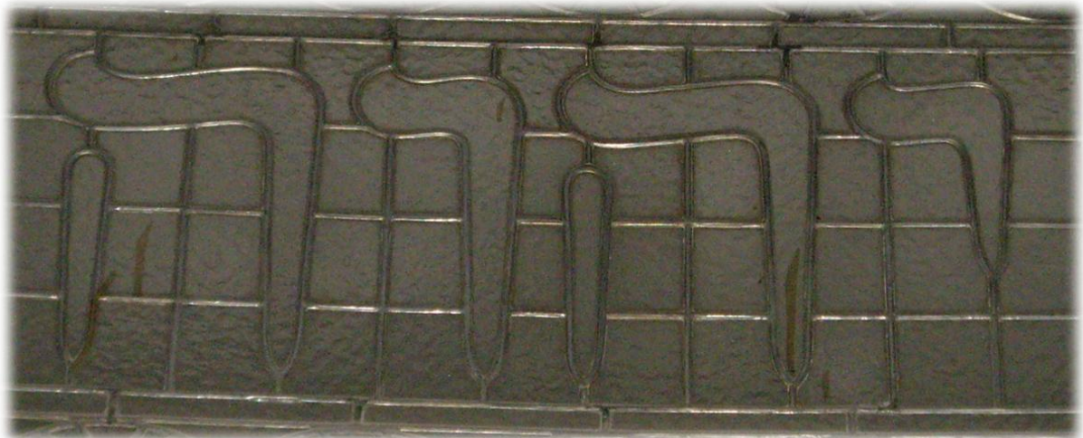
Även ovanför entrén finns gudsnamnet JHWH skrivet med hebreiska bokstäver