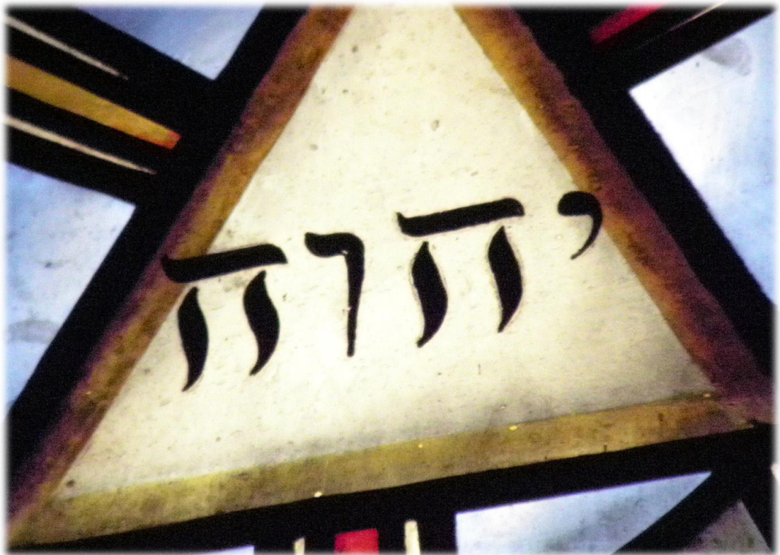
Gudsnamnet finns även på den plats i kyrkan som kallas "Scta Annas Kapell"