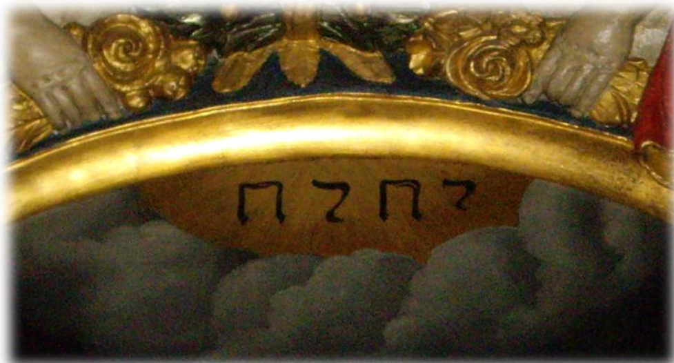
På en altartavla till höger i kyrkan finns också gudsnamnet JHWH med hebreiska bokstäver