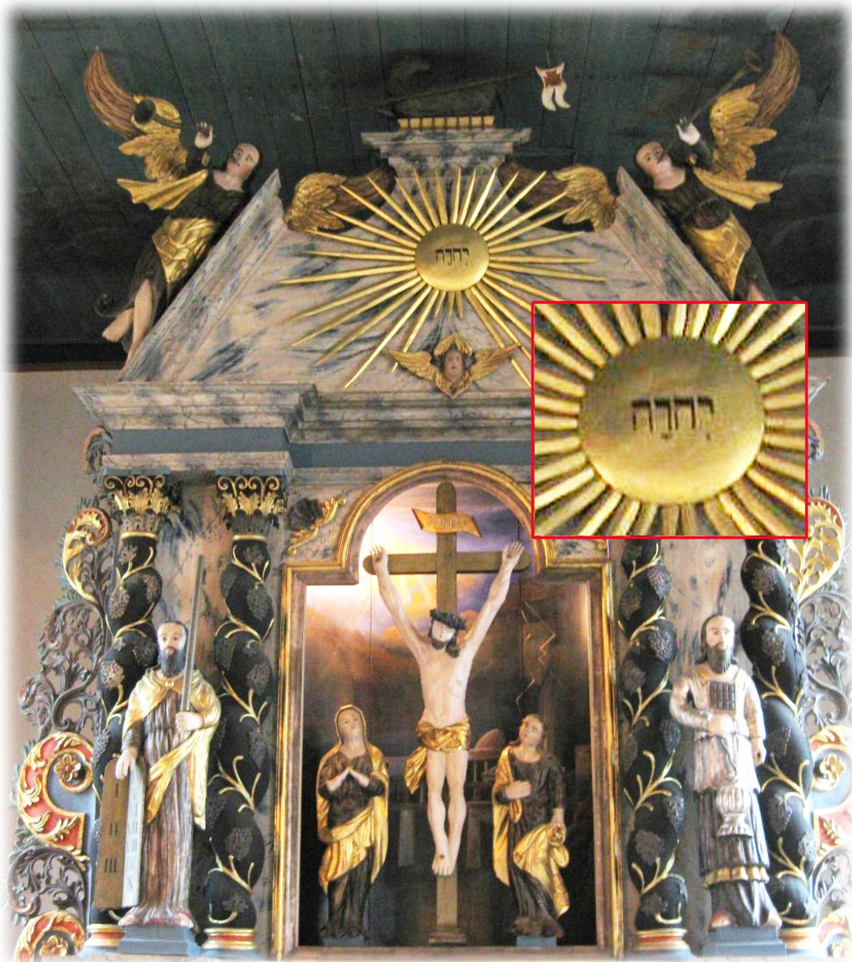
På altarpopsatsen från 1769 finns gudsnamnet JHWH med hebreiska bokstäver

JHWH, även kallat tetragrammet eller tetragrammaton, förekommer nästan 7000 gånger i den hebreiska texten i Bibeln