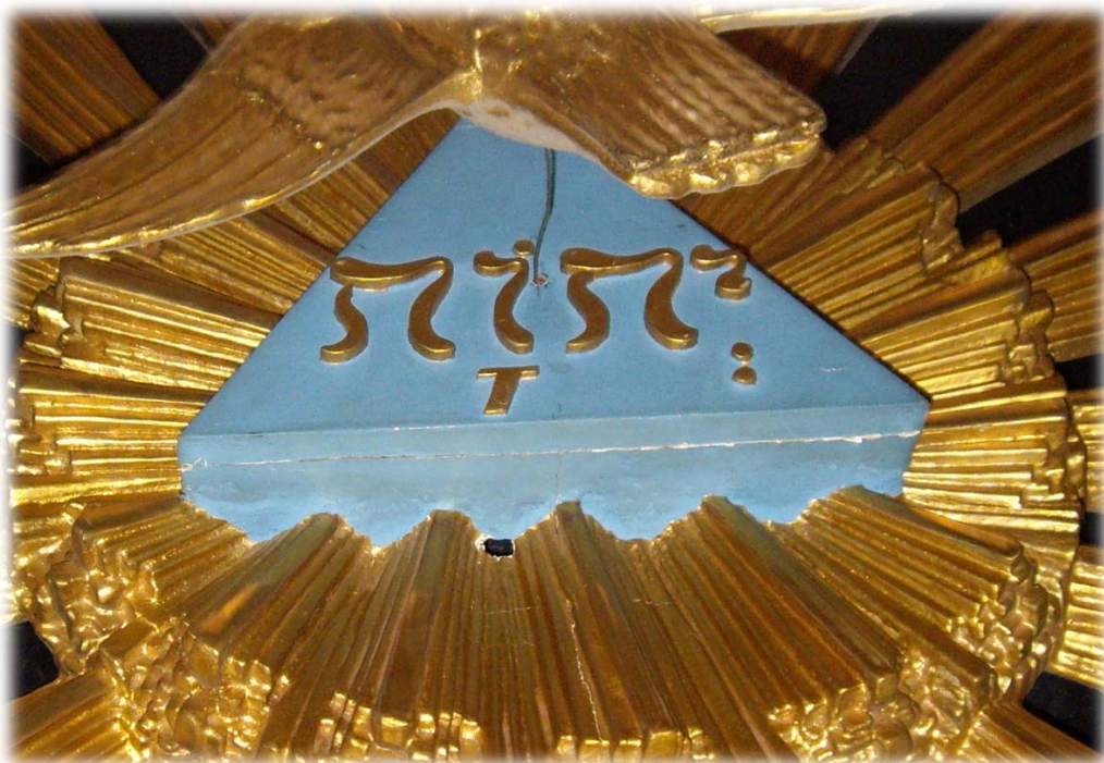
På undersidan av predikstolens baldakin finns gudsnamnet JHWH med hebreiska bokstäver (läses från höger till vänster)