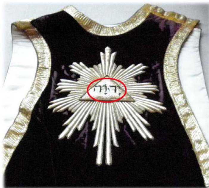
På två av kyrkans mässhakar finns också gudsnamnet JHWH med hebreiska bokstäver

Namnet Jehova, Jehovah, Jahve eller med de hebreiska bokstäverna JHWH (JHVH) förekommer i en mängd kyrkobyggnader och på olika föremål. Gudsnamnet finns också med i betydelsen i många namn. Exempel: Jesus betyder ” Jehova är räddning ”. Halleluja betyder ” Lovprisa Jah ” (Jah är en förkortad form av Jehova)