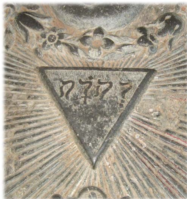
Även på en gravsten från 1744 finns gudsnamnet JHWH med hebreiska bokstäver