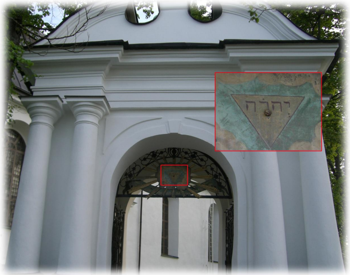
På entréporten till 1600-talskyrkan finns gudsnamnet JHWH med hebreiska bokstäver (läses från höger till vänster)

JHWH, även kallat tetragrammet eller tetragrammaton, förekommer nästan 7000 gånger i den hebreiska texten i Bibeln