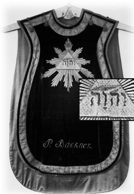
På en mässhake från 1787 finns gudsnamnet JHWH med hebreiska bokstäver

Namnet Jehova, Jehovah, Jahve eller med de hebreiska bokstäverna JHWH (JHVH) förekommer i en mängd kyrkobyggnader och på olika föremål. Gudsnamnet finns också med i betydelsen i många namn. Exempel: Jesus betyder " Jehova är räddning ". Halleluja betyder " Lovprisa Jah " (Jah är en förkortad form av Jehova)