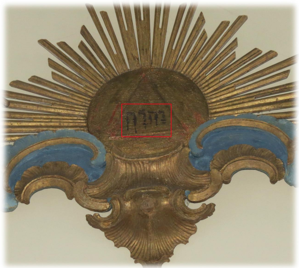
På en solsymbol finns gudsnamnet JHWH med hebreiska bokstäver

Namnet Jehova, Jehovah, Jahve eller med de hebreiska bokstäverna JHWH (JHVH) förekommer i en mängd kyrkobyggnader och på olika föremål. Gudsnamnet finns också med i betydelsen i många namn. Exempel: Jesus betyder " Jehova är räddning ". Halleluja betyder " Lovprisa Jah " (Jah är en förkortad form av Jehova)