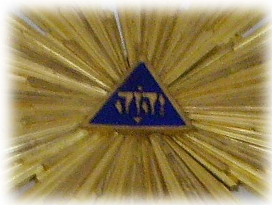
På altaruppsatsen finns gudsnamnet JHWH med hebreiska bokstäver