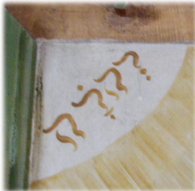
På läktarbarriären från 1742 finns gudsnamnet JHWH med hebreiska bokstäver