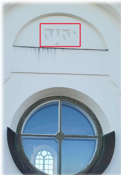
På fasaden finns gudsnamnet JHWH med hebreiska bokstäver

Namnet Jehova, Jehovah, Jahve eller med de hebreiska bokstäverna JHWH (JHVH) förekommer i en mängd kyrkobyggnader och på olika föremål. Gudsnamnet finns också med i betydelsen i många namn. Exempel: Jesus betyder " Jehova är räddning ". Halleluja betyder " Lovprisa Jah " (Jah är en förkortad form av Jehova)