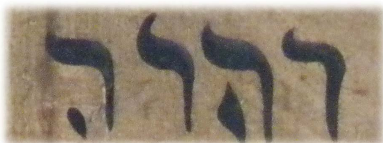
På altarpupsatsen finns gudsnamnet JHWH med hebreiska bokstäver (läses från höger till vänster)

Namnet Jehova, Jehovah, Jahve eller med de hebreiska bokstäverna JHWH (JHVH) förekommer i en mängd kyrkobyggnader och på olika föremål. Gudsnamnet finns också med i betydelsen i många namn. Exempel: Jesus betyder " Jehova är räddning ". Halleluja betyder " Lovprisa Jah " (Jah är en förkortad form av Jehova)