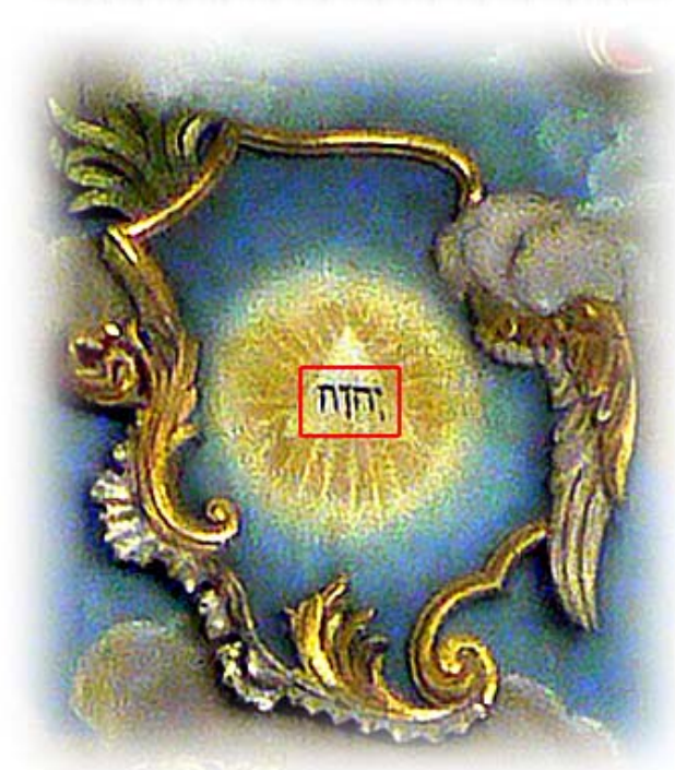
Gudsnamnet finns även vid orgeln från 1840-talet och på den gamla altartavlan

Namnet Jehova, Jehovah, Jahve eller med de hebreiska bokstäverna JHWH (JHVH) förekommer i en mängd kyrkobyggnader och på olika föremål. Gudsnamnet finns också med i betydelsen i många namn. Exempel: Jesus betyder " Jehova är räddning ". Halleluja betyder " Lovprisa Jah " (Jah är en förkortad form av Jehova)