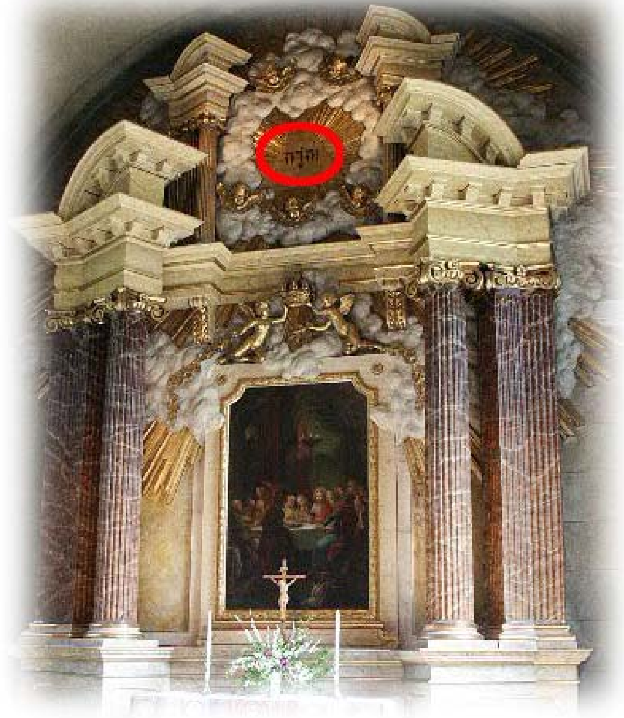
Altaruppsatsen från 1897 har gudsnamnet JHWH med hebreiska bokstäver