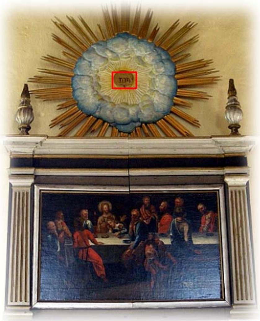
Även ovanför en äldre altartavla finns gudsnamnet JHWH med hebreiska bokstäver

Namnet Jehova, Jehovah, Jahve eller med de hebreiska bokstäverna JHWH (JHVH) förekommer i en mängd kyrkobyggnader och på olika föremål. Gudsnamnet finns också med i betydelsen i många namn. Exempel: Jesus betyder ” Jehova är räddning ”. Halleluja betyder ” Lovprisa Jah ” (Jah är en förkortad form av Jehova)