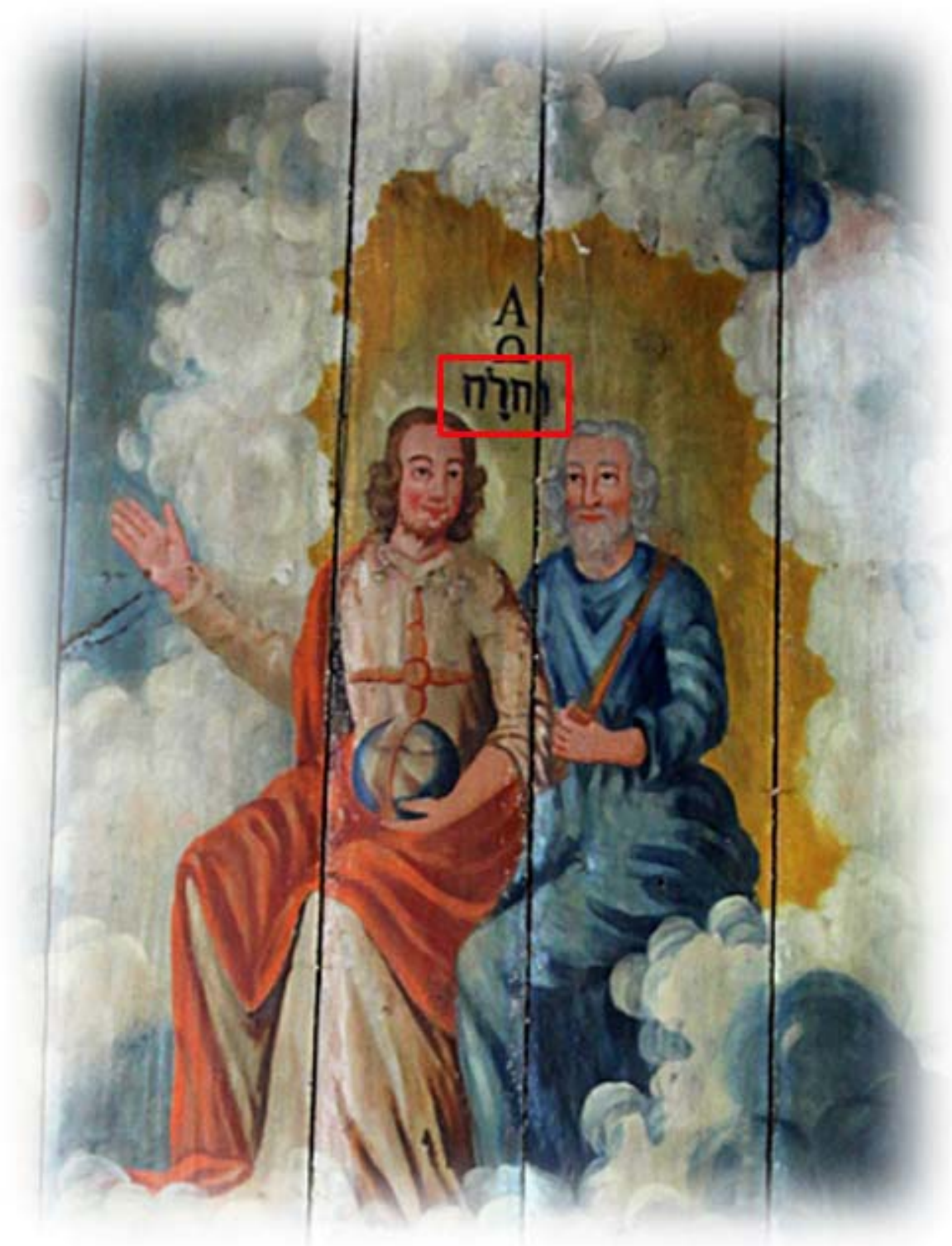
I takmålningen från 1756 finns gudsnamnet JHWH skrivet med hebreiska bokstäver (läses från höger till vänster)

JHWH, även kallat tetragrammet eller tetragrammaton, förekommer 6828 gånger i den hebreiska texten i Bibeln