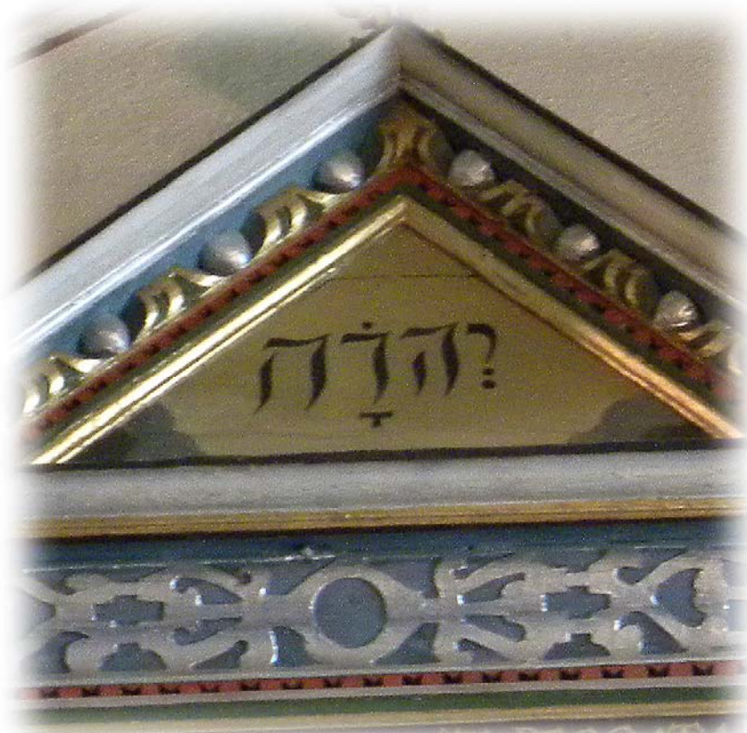
På detta epitafium över Mats Jörensso från 1620 finns gudsnamnet JHWH med hebreiska bokstäver