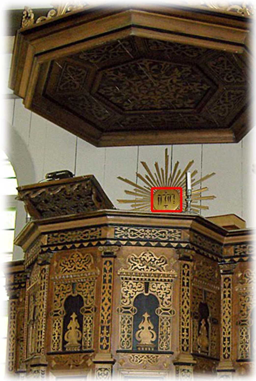
Vid predikstolen, som är från 1662, finns gudsnamnet JHWH med hebreiska bokstäver (läses från höger till vänster)

JHWH, även kallat tetragrammet eller tetragrammaton, förekommer 6828 gånger i den hebreiska texten i Bibeln