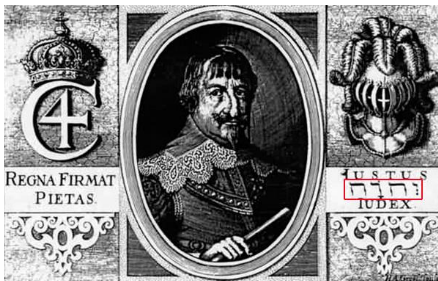
Ovanstående är ett tryck från en kopparplåt med ett porträtt av kung Christian IV. På sidorna ses ornament och inskriptioner. Kopparplåten användes för tilltryck på dokument. Till höger ses texten: IUSTUS JEHOVA IUDEX (Jehova [Gud] är en rättfärdig domare)