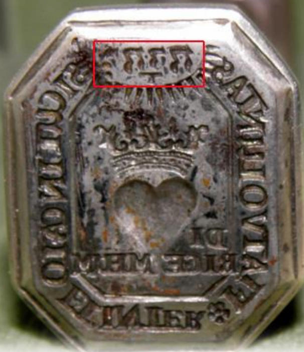
Kungens privata sigillstämpel som användes i mera inofficiella sammanhang

Christian IV var regent över Danmark och Norge mellan 1588 - 1648