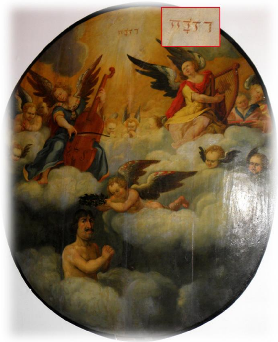
En av kungens drömsyner där konstnären använt gudsnamnet JHWH med hebreiska bokstäver