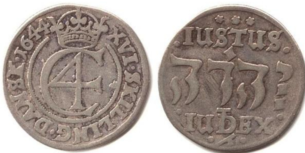
Texten IUSTUS JEHOVA IUDEX (Jehova [Gud] är en rättfärdig domare) gjorde att mynten fick det folkliga namnet "Hebræermønter" eftersom namnet Jehova var skrivet på hebreiska. Under kungens regenttid utgavs mer än 60 olika mynt