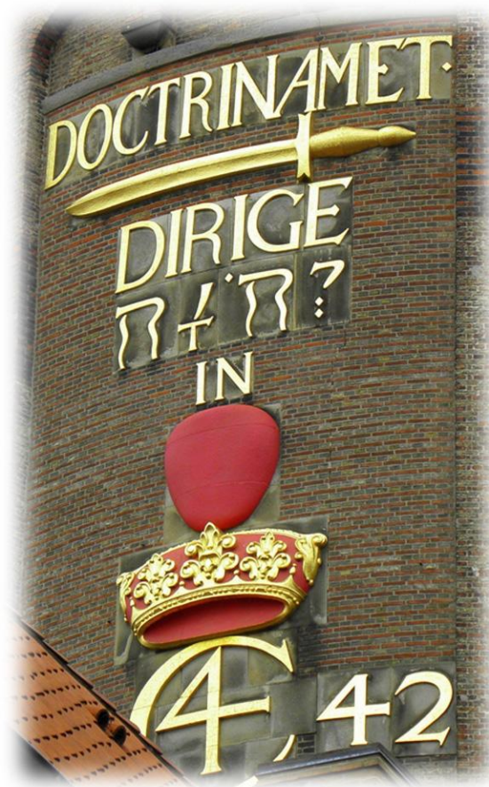
På Rundetårn i Köpenhamn, som byggdes på uppdrag av Christian IV (färdigt år 1642), finns en inskription som kan utläsas så här: "Led Jehova den rätta lära in i kung Christian IV:s hjärta"