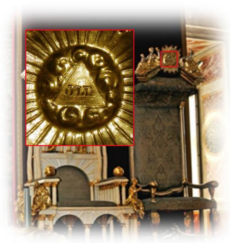
Bredvid kungens tron finns drottningens tronstol på Rosenborgs slott med tetragrammet JHWH i solsymbolen