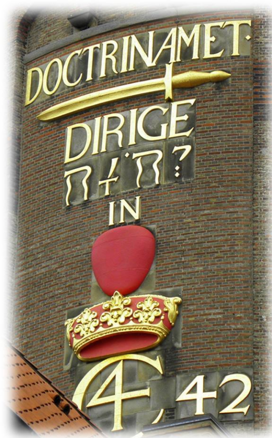
På Rundetårn i Köpenhamn, som byggdes på uppdrag av Christian IV (färdigt år 1642), finns en inskription som kan utläsas så här: "Led Jehova den rätta lära in i kung Christian IV:s hjärta". Mer info i filmen Det dolda namnet II