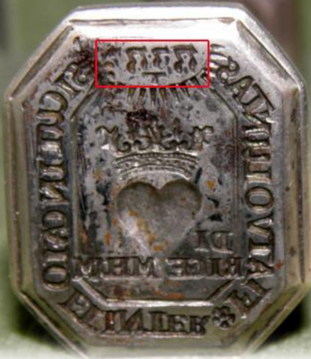
Kungens privata sigillstämpel som användes i mera inofficiella sammanhang

Christian IV var regent över Danmark och Norge mellan 1588 - 1648