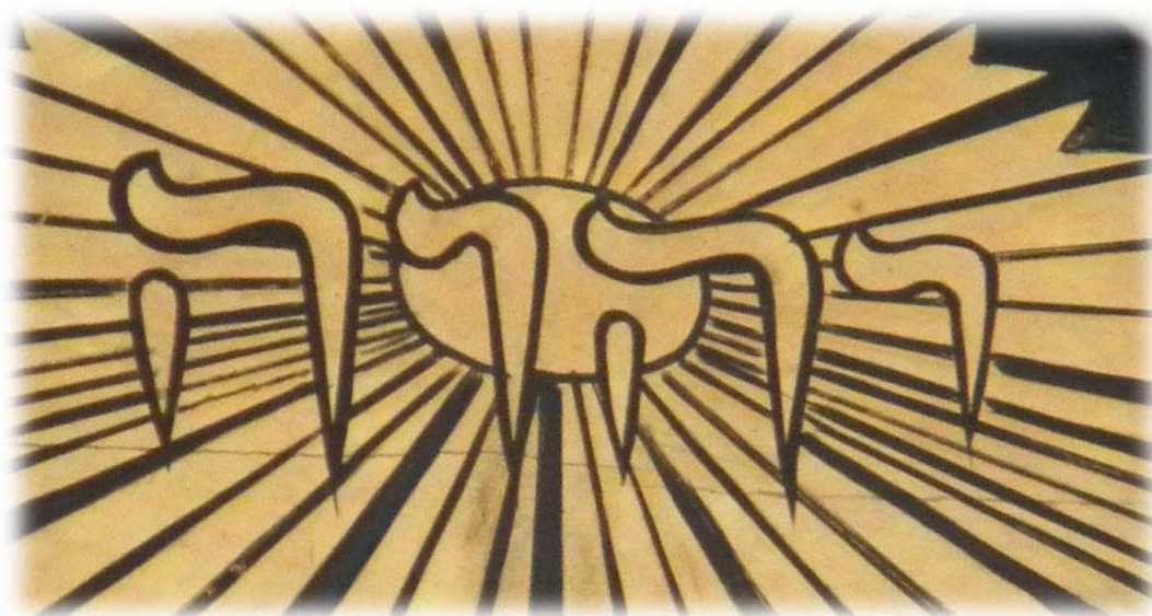
Ovanför altartavlan från 1870-talet finns gudsnamnet JHWH med hebreiska bokstäver (läses från höger till vänster)