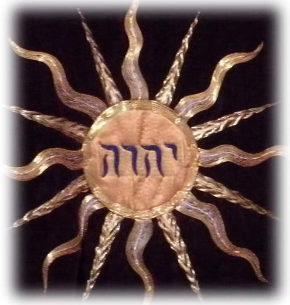
Även på en mässhake finns gudsnamnet JHWH med hebreiska bokstäver

Namnet Jehova, Jehovah, Jahve eller med de hebreiska bokstäverna JHWH (JHVH) förekommer i en mängd kyrkobyggnader och på olika föremål. Gudsnamnet finns också med i betydelsen i många namn. Exempel: Jesus betyder ” Jehova är räddning ”. Halleluja betyder ” Lovprisa Jah ” (Jah är en förkortad form av Jehova)