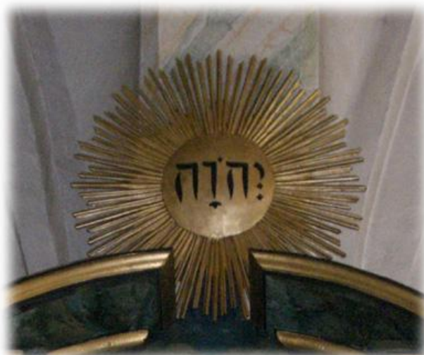
Även på altarupsatsen från 1661 finns gudsnamnet JHWH med hebreiska bokstäver

Namnet Jehova, Jehovah, Jahve eller med de hebreiska bokstäverna JHWH (JHVH) förekommer i en mängd kyrkobyggnader och på olika föremål. Gudsnamnet finns också med i betydelsen i många namn. Exempel: Jesus betyder ” Jehova är räddning ”. Halleluja betyder ” Lovprisa Jah ” (Jah är en förkortad form av Jehova)