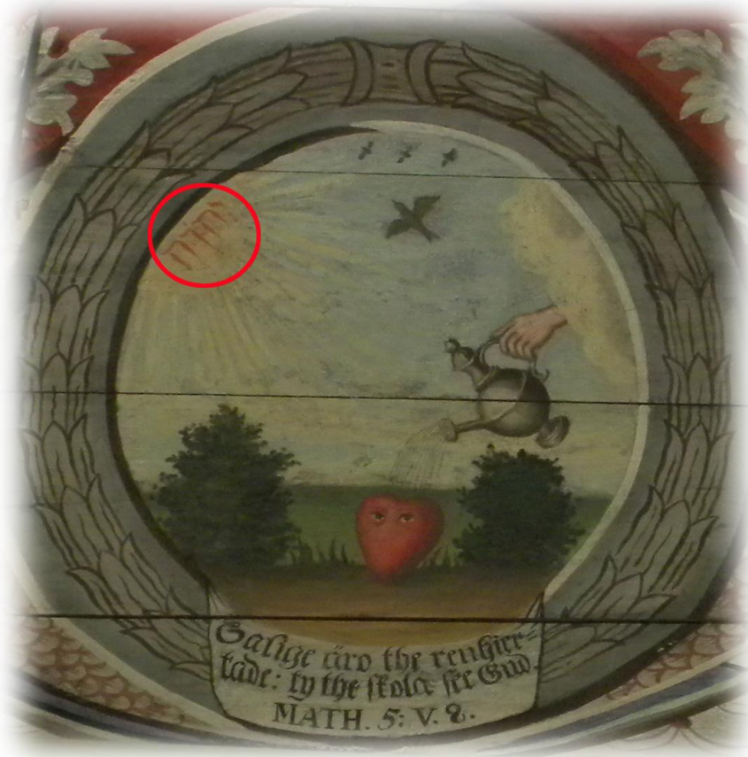
I takmålningen från 1745 (troligen utförd av Lars Hasselbom) finns gudsnamnet JHWH med hebreiska bokstäver (läses från höger till vänster)