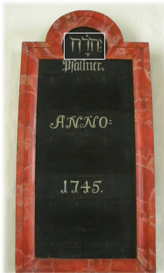
Även på en psalmtavla från 1745 finns gudsnamnet JHWH med hebreiska bokstäver