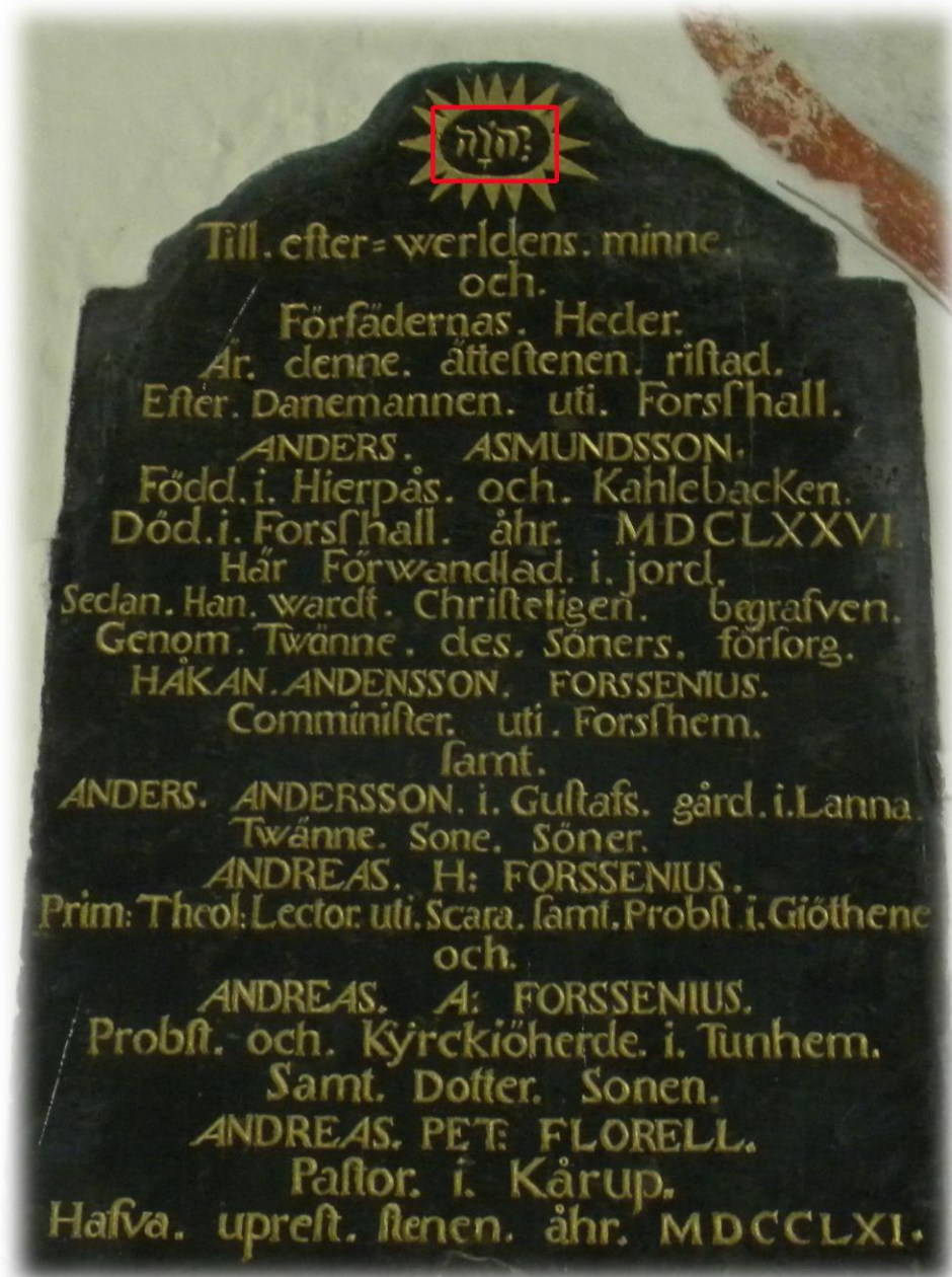
På ett epitafium från 1761 finns gudsnamnet JHWH med hebreiska bokstäver

Namnet Jehova, Jehovah, Jahve eller med de hebreiska bokstäverna JHWH (JHVH) förekommer i en mängd kyrkobyggnader och på olika föremål. Gudsnamnet finns också med i betydelsen i många namn. Exempel: Jesus betyder " Jehova är räddning ". Halleluja betyder " Lovprisa Jah " (Jah är en förkortad form av Jehova)