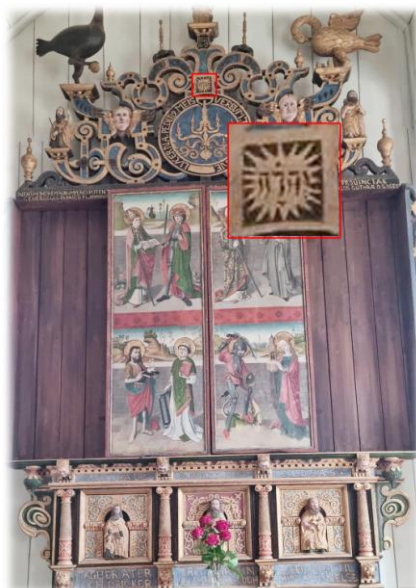
På altarskåpet från 1490-talet finns gudsnamnet JHWH med hebreiska bokstäver