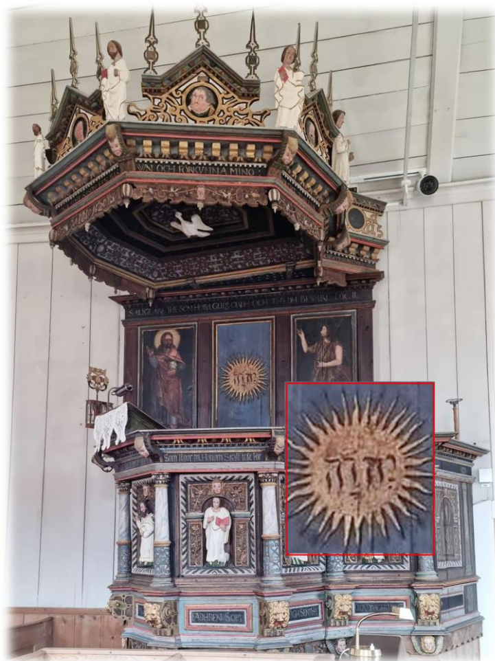
På predikstolen från 1621 finns gudsnamnet JHWH med hebreiska bokstäver (läses från höger till vänster)

JHWH, även kallat tetragrammet eller tetragrammaton, förekommer omkring 7000 gånger i Bibelns grundtext