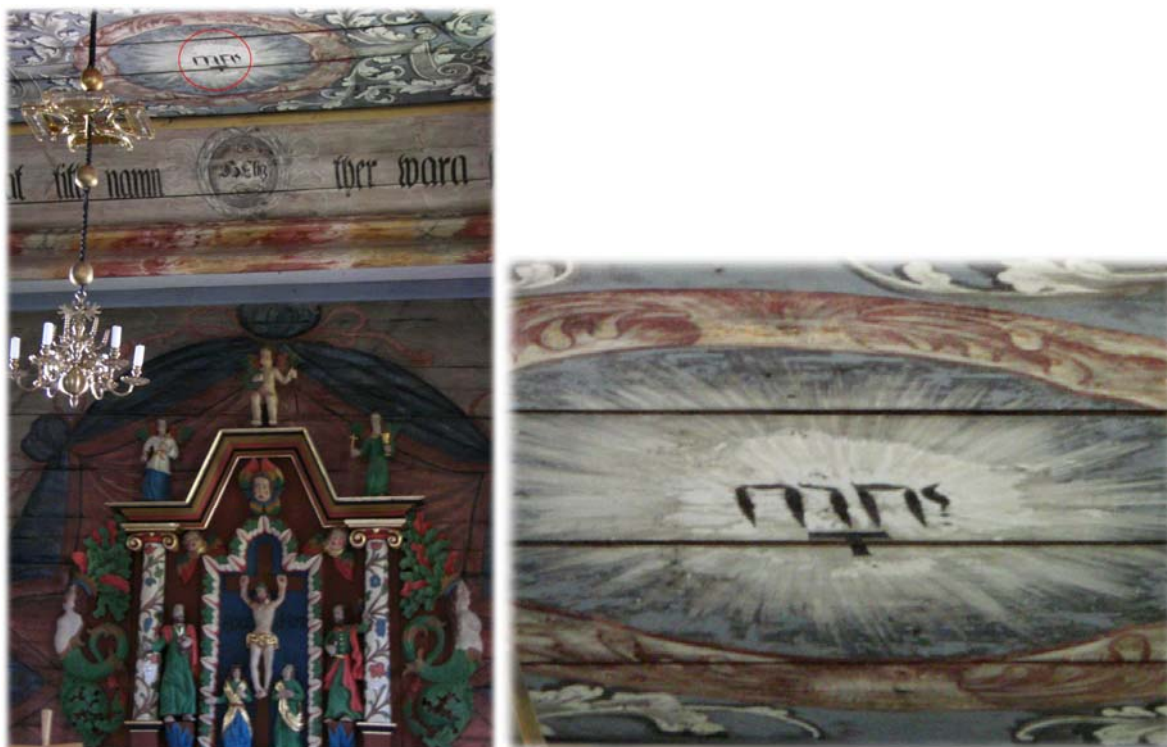
I takmålningen från 1757 finns gudsnamnet JHWH med hebreiska bokstäver (läses från höger till vänster)

Namnet Jehova, Jehovah, Jahve eller med de hebreiska bokstäverna JHWH (JHVH) förekommer i en mängd kyrkobyggnader och på olika föremål. Gudsnamnet finns också med i betydelsen i många namn. Exempel: Jesus betyder " Jehova är räddning ". Halleluja betyder " Lovprisa Jah " (Jah är en förkortad form av Jehova)